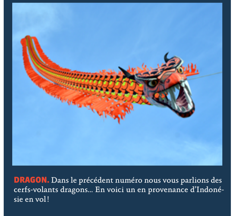
DRAGON. Dans le précédent numéro nous vous parlions des cerfs-volants dragons... En voici un en provenance d'Indonésie en vol !